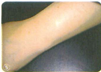
5. The application is now complete.