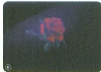
6. You're done! Hold your temporary tattoo under a black light and the design will appear!