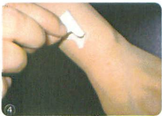
4. Gently peel off the backing.