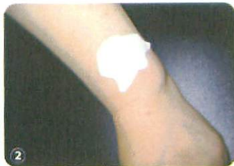
2. Place it on skin where desired.