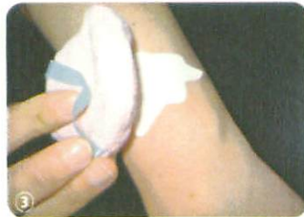
3. Apply water onto the backing and apply pressure for about 30 seconds.